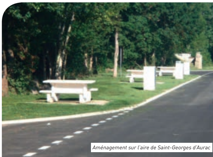
Aménagement sur l'aire de Saint-Georges d'Aurac