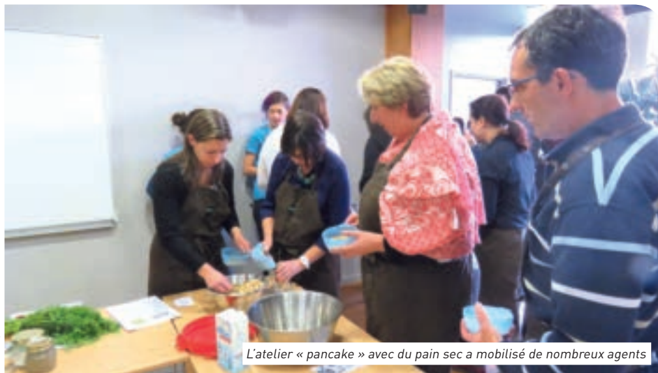
L'atelier « pancake » avec du pain sec a mobilisé de nombreux agents