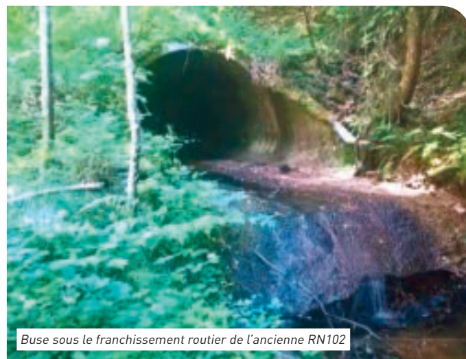
Buse sous le franchissement routier de l'ancienne RN102