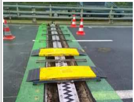
Changement de joint de chaussée