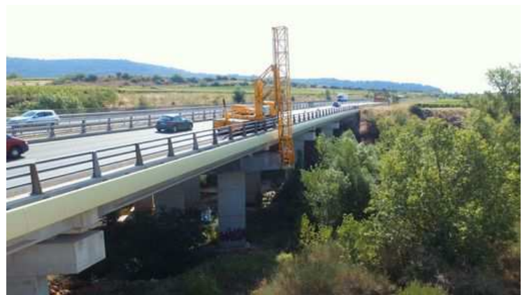
Travaux Marguerite Ouest (phase 1)

La phase 1 a été menée en deux temps en 2020 (fortement impactée par la crise Covid-19), elle a concerné trois ponts construits en 1990 et 1991 : les deux ouvrages du sens sud/nord (partie Est) sur la Lergue (viaduc à travées indépendantes, poutres précontraintes par post-tension) et celui du sens nord-sud sur la Marguerite (partie Ouest) (poutres précontraintes par adhérence). Ces trois ouvrages ont fait l'objet d'une remise à niveau des conditions d'appui et des équipements défectueux.